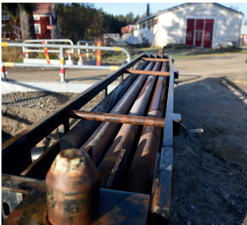
Bild från tidigare tillfälle. Borrstänger som användes vid styrd borrhning längs Folkskolevägen, Vindeln.